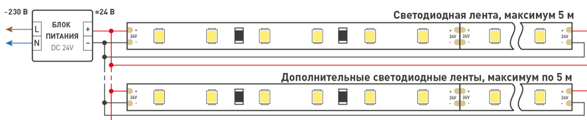
Схема 2. Подключение нескольких светодиодных лент с двух сторон. Рекомендуется использовать для обеспечения равномерного свечения ленты по всей длине.